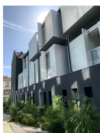
Le Lavoir Numérique, façade historique © Arteo architectures - Cécile Septet